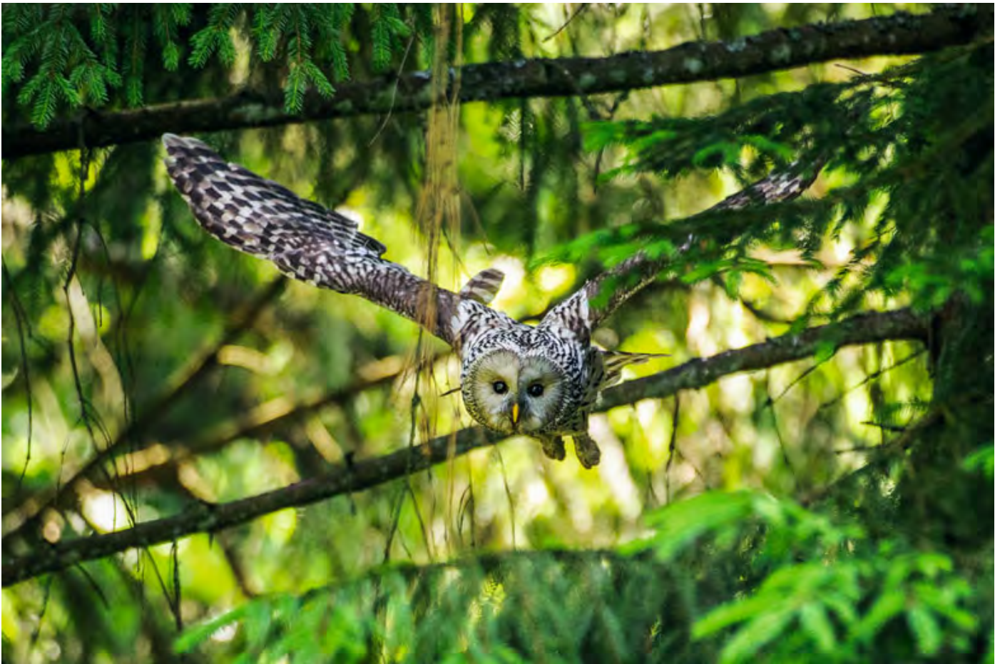
Abb. 1: Der VLAB und seine Partner hoffen, dass der Habichtskauz bald seine alten Lebensräume in Nordostbayern wiederbesiedeln kann. The VLAB including all collaborators hopes to soon be successful in the endeavour of introducing the ural owl back into its natural habitat in northeastern Bavaria.