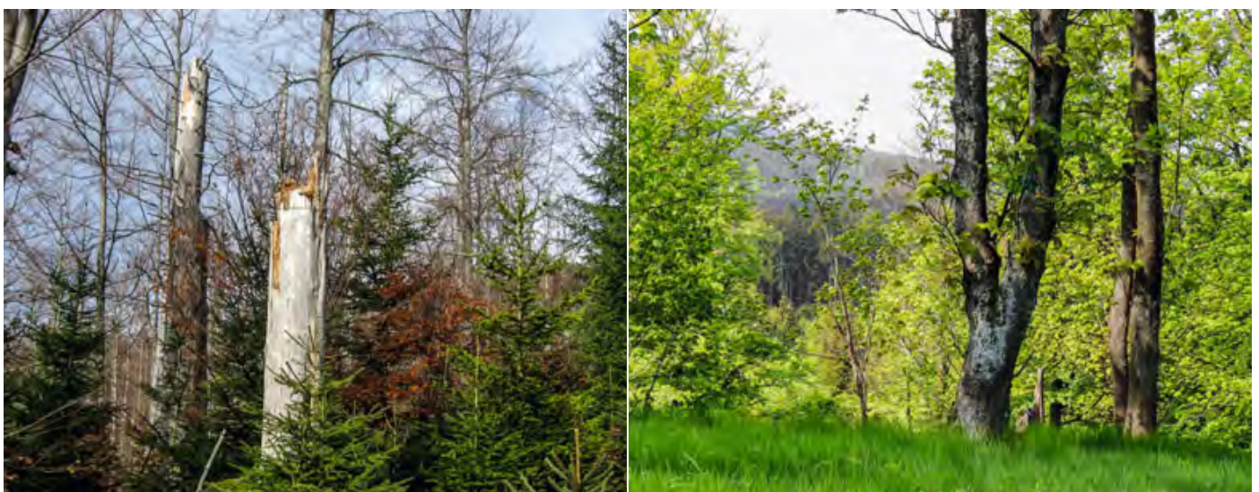
Abb. 7 + 8: Bei dem Wiederansiedlungsprojekt werden stehendes Totholz, Hochstümpfe und Freiflächen im Wald erhalten und gefördert. Neben dem Habichtskauz profitieren viele Pflanzen-, Pilz- und Tierarten davon.

Hauptziel des Projektes ist es, eine lebensfähige Kleinpopulation mit mindestens 10 bis 15 Habichtskauz-Brutpaaren zu etablieren. Diese soll sich langfristig ohne menschliche Hilfe in den Wäldern der nordostbayerischen und nordwestböhmischen Mittelgebirge ausbreiten und mit der bisher isolierten Kleinpopulation des bayerisch-böhmischen Waldes im Südosten vernetzen. Flankierend dazu werden bis zu 200 Brutkästen an geeigneten Standorten im Wald installiert, welche die vorhandenen natürlichen