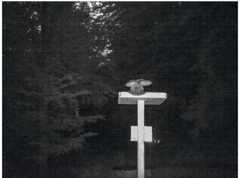
Abb. 13: Ein junger Habichtskauz kehrt in der Dämmerung wenige Tage nach seiner Freilassung am 20.7.2018 an den Futtertisch zurück.

A few days after its release into the wild on 20 July 2018, a young ural owl returned to feed at the installed feeding table at dusk.