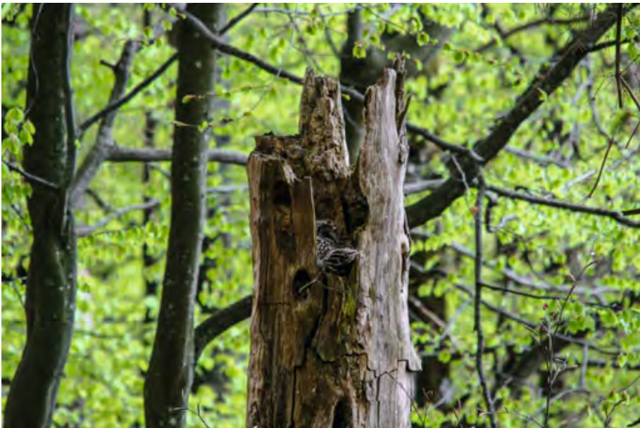
Abb. 16: Alte verrottende Hochstümpfe sind ein idealer Brutraum für den Habichtskauz. Decaying and hollow high stumps of large old trees are the ideal breeding areas for the ural owl.

Habichtskäuze findet im Herbst 2018 durch geschulte ehrenamtliche Beobachter statt.