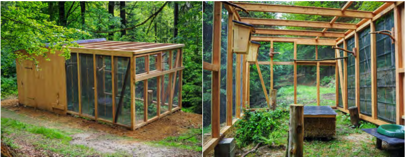
Abb. 10 + 11: Moderne Eingewöhnungsvoliere mit einer „Mäuseburg“ bietet bis zu sechs Jungeulen Platz zur Übung für die Mäusejagd und Gewöhnung an ihren neuen Lebensraum.

State of the art acclimation aviary including a “mouse sanctuary” helping to attract living prey. The aviary offers space for up to six young owls adapting to the local habitat and learning to hunt.