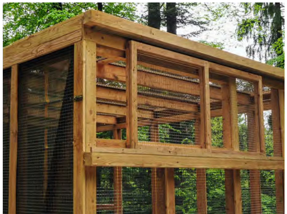
Abb. 12: Luke zum Öffnen der Voliere. Hatch to open the aviary.

Zur Beschleunigung des Bruterfolges und als Übergang, bis genügend natürliche Bruträume in älteren hohlen Bäumen oder in Hochstümpfen bereit stehen, wurden bisher 70 Brutkästen gebaut und an Bäumen angebracht. Den Boden der Nisthilfe füllte man vorher mit ca. 8 Liter Holzmulm zur Eiablage auf. Die Installation der Brutkästen erfolgte an geeigneten Standorten mit zwei bis drei