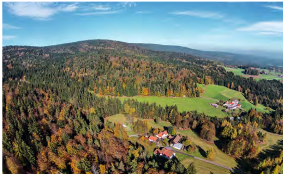
Abb. 5: Der südliche Teil des Naturparks Steinwald liegt im Kerngebiet der Wiederansiedlung. Ältere Mischwälder und extensive Landwirtschaft kennzeichnen diesen Naturraum. The southern part of the natural reserve “Steinwald” comprises the central region of the re-introduction area. Old mixed forests and extensive agriculture are characteristics of the landscape found in this region.

Der Uralkauz brütet in großen Baumhöhlen und auf stärkeren morschen Baumstümpfen ab etwa 3,5 bis zu maximal 21 m Höhe. Häufig nistet er in verlassenen Horsten von Habicht, Mäusebussard ( Buteo buteo ), Fisch- ( Pandion haliaetus ) und Schreiadler ( Clanga pomarina ) sowie Schwarzstorch ( Ciconia nigra ). Sehr selten wurden Bruten auch in Steinklüften nachgewiesen. Der Habichtskauz bevorzugt keine bestimmten Baumarten. Angebotene künstliche Nisthilfen nimmt