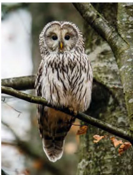
Abb. 3: Adulter Habichtskauz. Adult ural ow.

Der Habichtskauz ist mit einer Größe von rund 60 cm und einer Spannweite bis zu 125 cm die größte ausschließlich im Wald lebende Eule Mitteleuropas. Er erreicht ein Gewicht von ca. 650 bis maximal