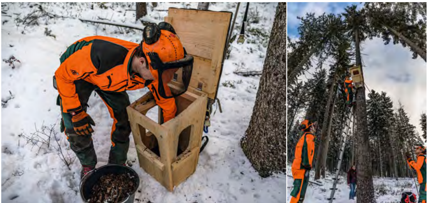
Abb. 14 + 15: Bevor man die schweren Brutkästen an Bäumen installiert, werden sie mit acht Liter Holzmulm aufgefüllt. Before mounting, the heavy nesting boxes are filled with eight liters of wooden mulch harvested from decaying trees.

Kenntnis. Sie wurden mit Trümmerbrüchen und Frakturen am Oberarm tierärztlich versorgt. Ein Habichtskauz musste auf Grund der Schwere seiner Verletzungen euthanasiert werden. Der andere Kauz konnte erfolgreich operiert werden und soll künftig als Zuchttier für das Auswilderungsprojekt dienen. Ein erstes flächiges akustisches Monitoring („Verhören“) der ausgewilderten