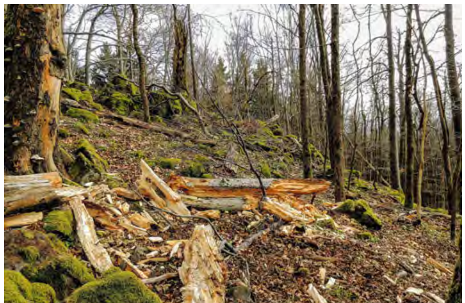
Abb. 6: Alte Edellaubholzwälder sind charakteristisch für die naturnahen Basaltkuppen im Projektgebiet. Sie sind als FFH/Natura 2000-Gebiete geschützt. Old and long established deciduous woodlands typically cover the natural basaltic hills in the project area. These wooded areas are protected under the “FFH/Natura 2000-Gebiet” status.

oder Höhlenbäumen zum Brüten. Selbst aus reinen Nadelholzbeständen liegen Brutnachweise aus Österreich vor. Die Wälder sollten mit Waldwiesen und sonstigen Freiflächen durchsetzt sein, damit er nach seiner Hauptbeute, den Mäusen, jagen kann. Stehende oder fließende Gewässer im Wald sind von großem Vorteil für seine Ansiedlung. Kalte Nordlagen und sehr steiles Gelände werden als Revier und Streifgebiet meist gemieden (KOHL & LEDITZNIK, 2014).