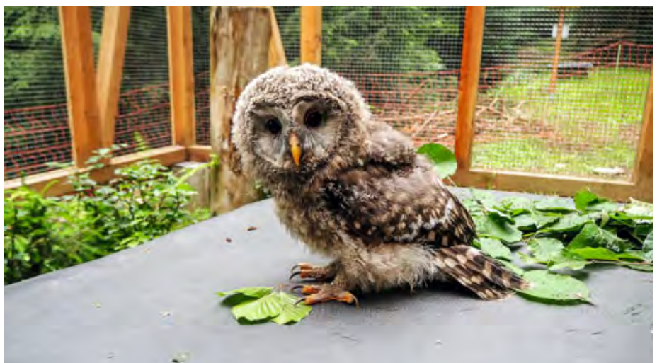
Abb. 4: Ca. acht Wochen alter Jungkauz aus dem Tierpark Gotha/Thüringen bei seiner Ankunft in der Eingewöhnungsvoliere am 13. Juni 2018.

Approx. eight-week-old ural owl provided by the Zoo "Tierpark Gotha/Thüringen" pictured on June 13, 2018 on arrival in the acclimatization aviary.